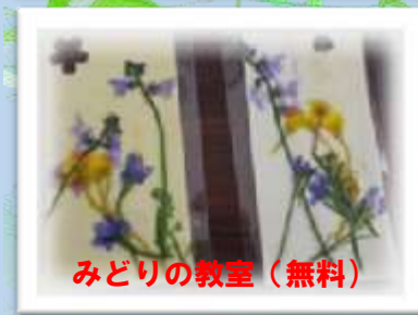
みどりの教室（無料）