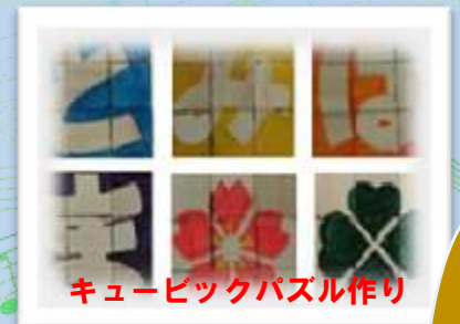
キュービックパズル作り