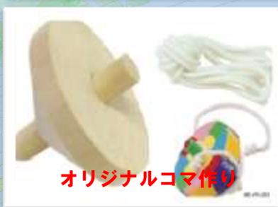
オリジナルコマ作り