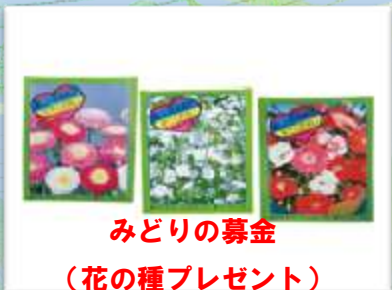
みどりの募金 （花の種プレゼント）