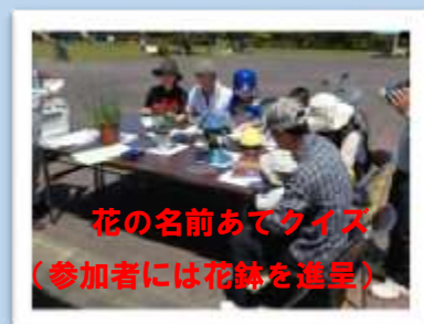
花の名前あてクイズ （参加者には花鉢を進呈）