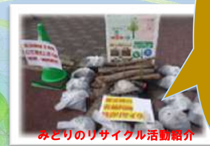
みどりのリサイクル活動紹介