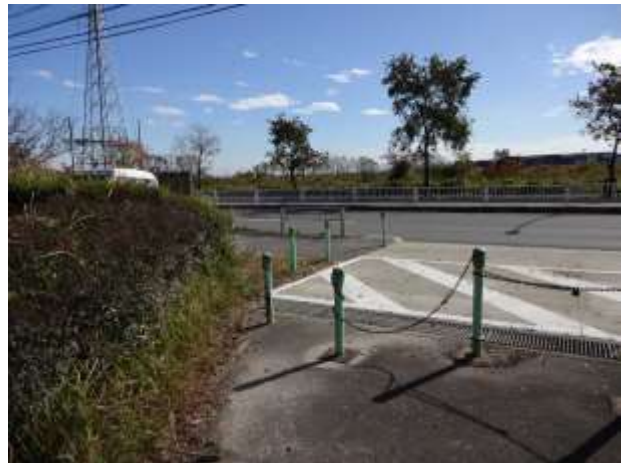
小グラウンド前（トイレ休憩所あり）を通過し、その先は一度道路に出ます。