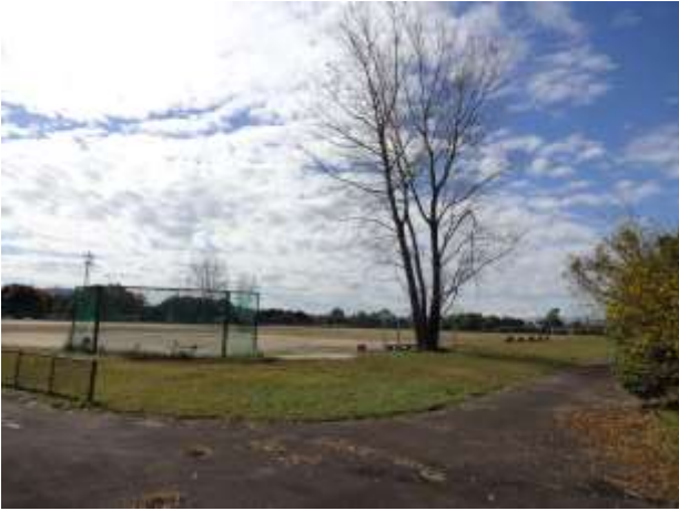
多目的スポーツ広場前を通過