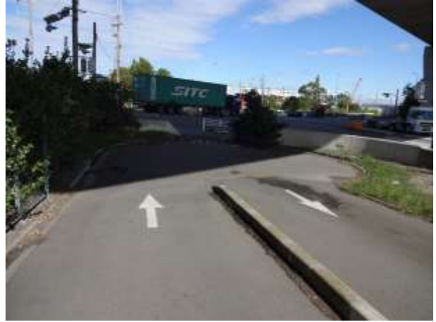
松並木を通過した先に、楠一丁目の交差点があります。注意して渡ります。